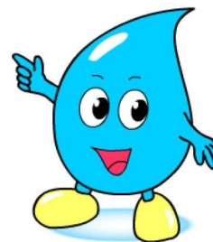
川口市水道局イメージキャラクター「みず太郎」