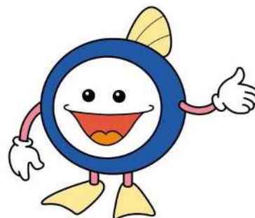
下水道マスコットキャラクター 「スイスイ」