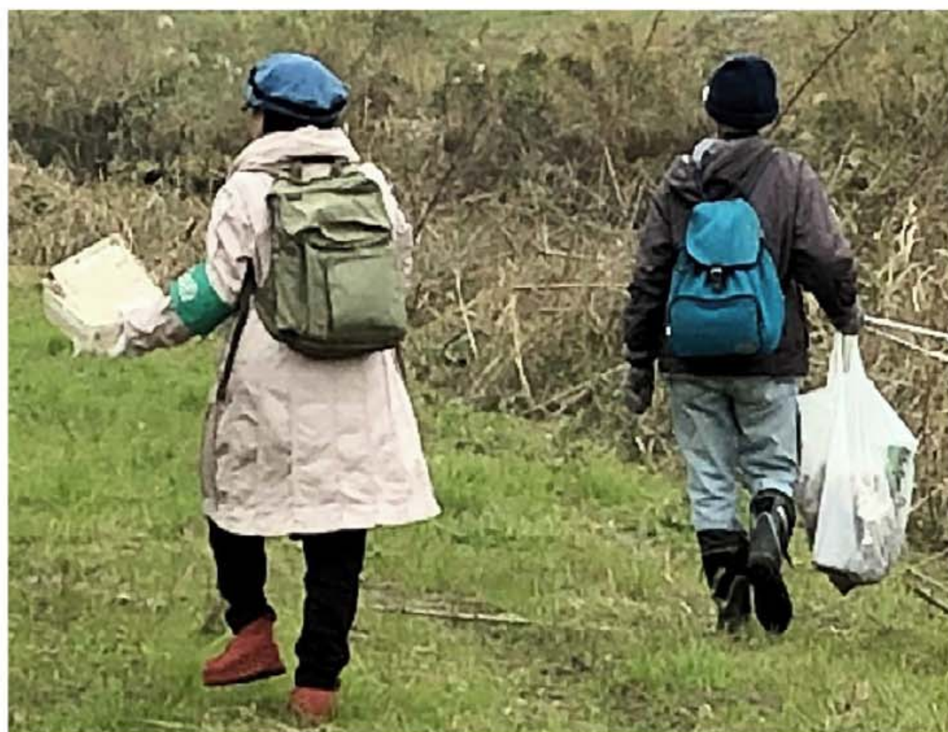
清掃活動の様子。この日はビニール、タバコの吸殻などのごみが多く見られました。