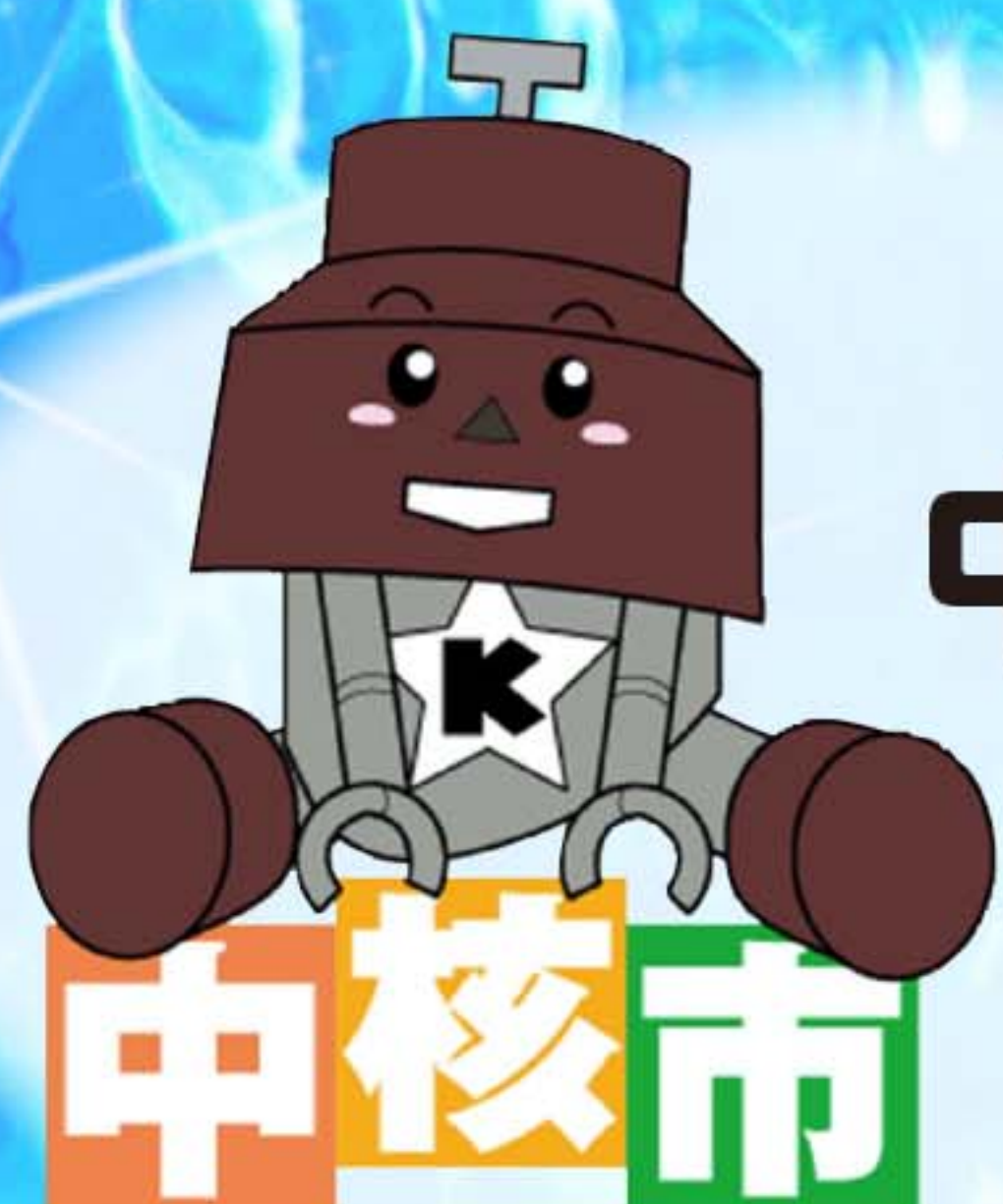
川口市マスコット「きゅぼらん」