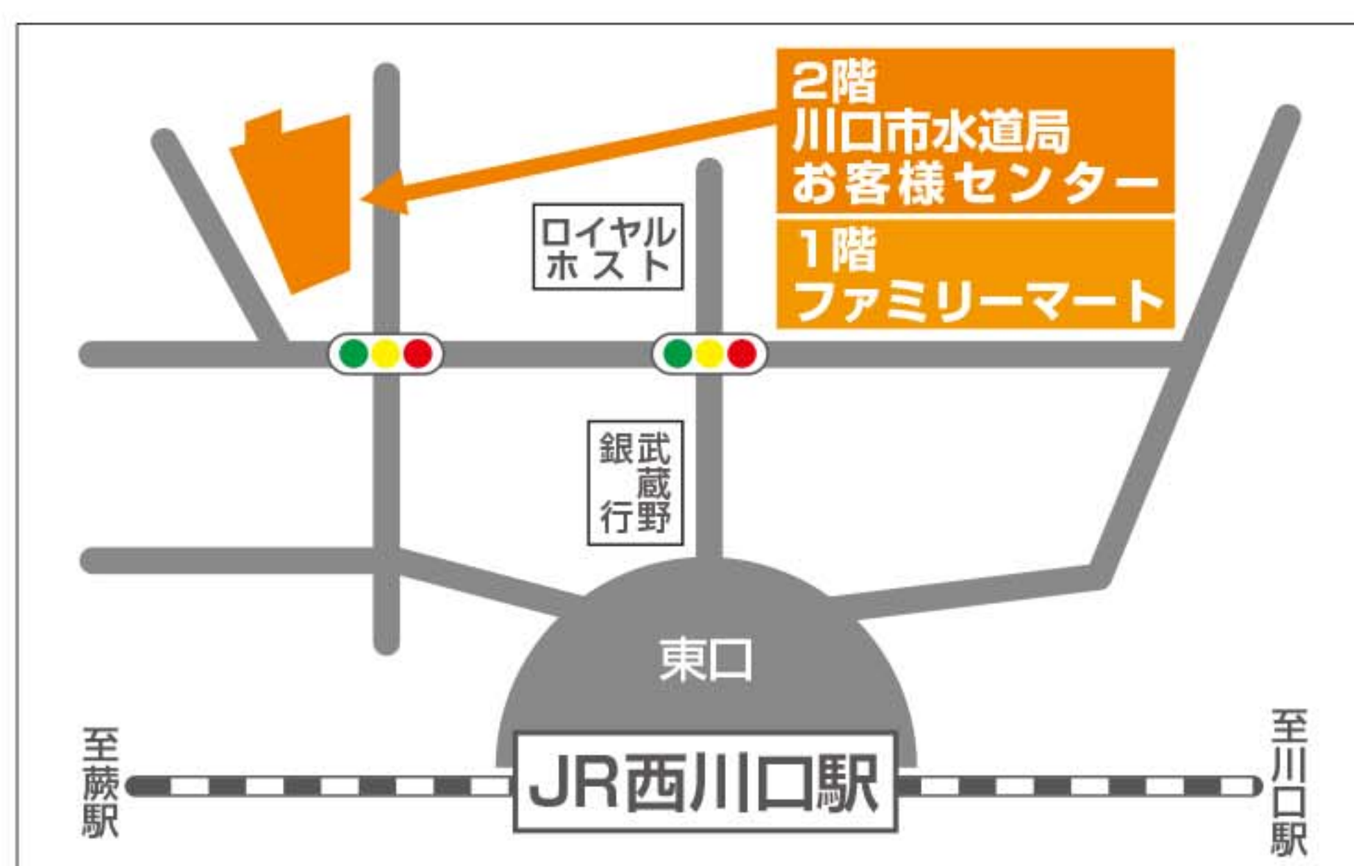
西川口駅から徒歩5分

水道料金のお支払いは口座振替が安全・便利です。 水道の使用開始・中止のお届けは、インターネットでのお手続きも可能です。