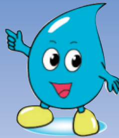
川口市水道局 キャラクター 「みず太郎」

水道局では地震などの災害時に、臨時の給水所を開設して水をお配りします。非常時への備えを強化するため、災害時の指定給水所を平成30年12月から33か所増設し93か所とします。いざという時のため、最寄りの指定給水所を確認しておきましょう。