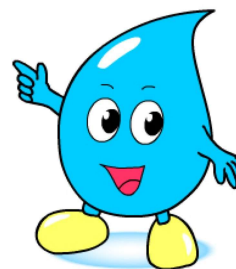
川口市上下水道局キャラクター「みず太郎」