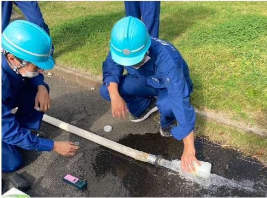
③水質確認訓練（浄水施設復旧班）