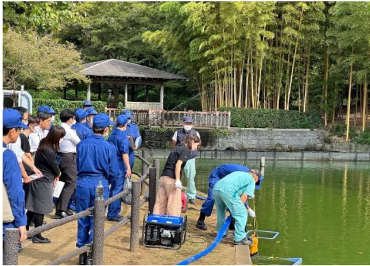
⑤排水ポンプ設置訓練（下水道班）