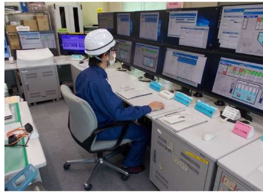
⑥無人ポンプ場の遠隔操作訓練（ポンプ場班）