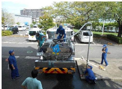
② 応急給水資機材操作訓練（応急給水班）