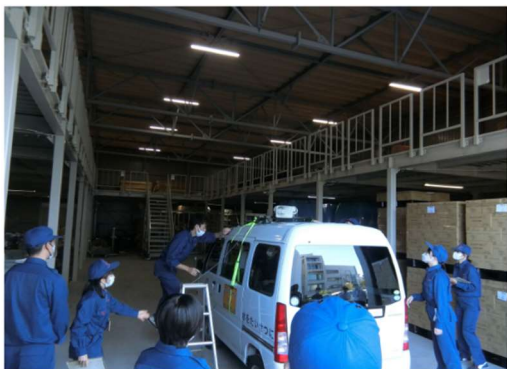
① 広報車の使用確認訓練（上下水道総務班）