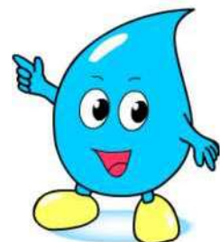
川口市上下水道局キャラクター「みず太郎」