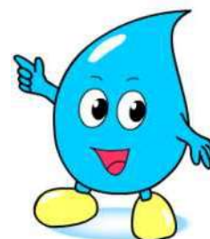
川口市上下水道局キャラクター「みず太郎」