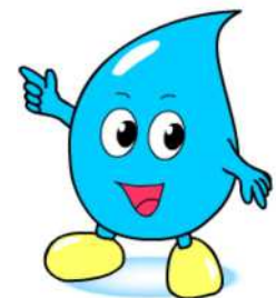
川口市上下水道局キャラクター「みず太郎」